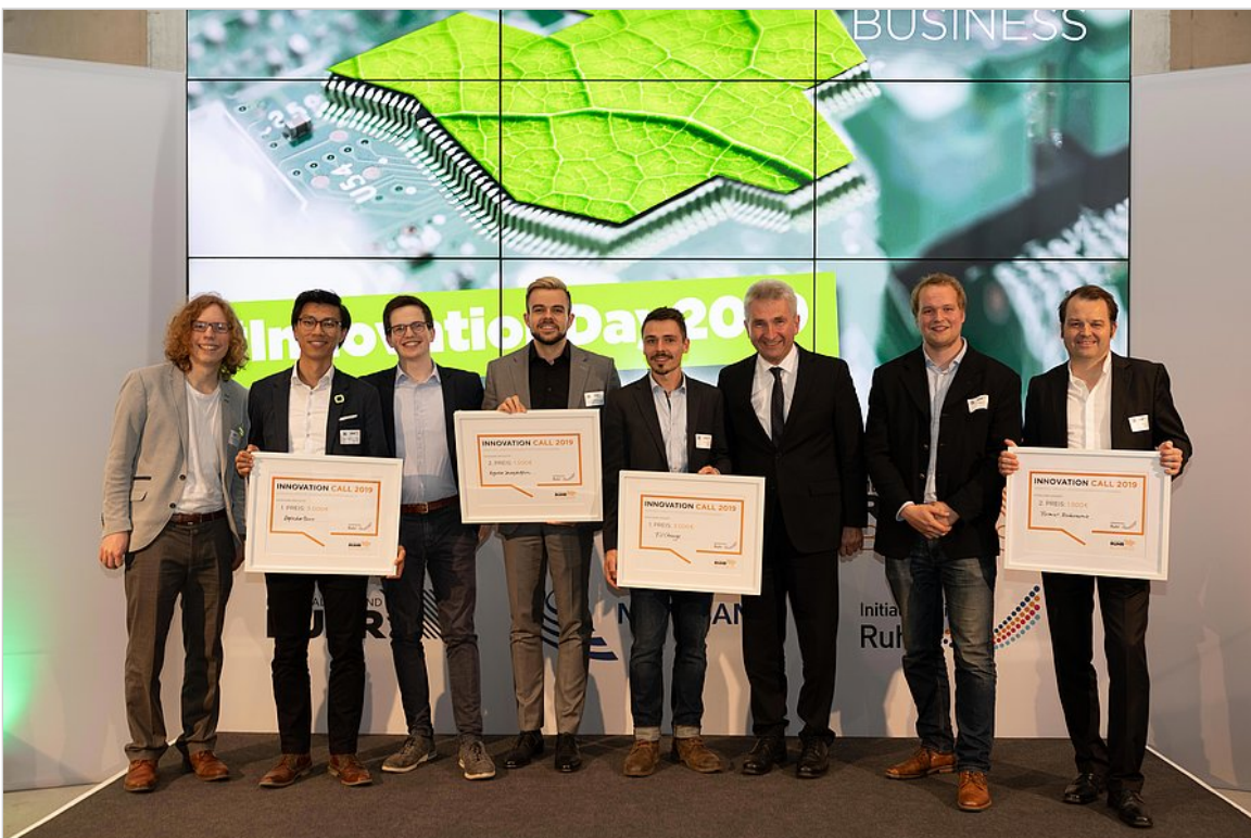
Die Gewinner des Innovation Call 2019 mit NRW-Wirtschaftsminister Prof. Dr. Andreas Pinkwart (3.v.r.).

Ein neuartiger 3D-Drucker und ein Kleiderreinigungsgerät, das ohne Wasser und Chemie auskommt: Diese beiden Ideen sind die Gewinner des Innovation Call 2019. Die Sieger des bundesweiten Wettbewerbes stammen aus Dortmund und Aachen und setzten sich gegen sieben weitere Teilnehmer durch. Das Preisgeld von insgesamt 9.000 Euro stellte der Initiativkreis Ruhr bereit.