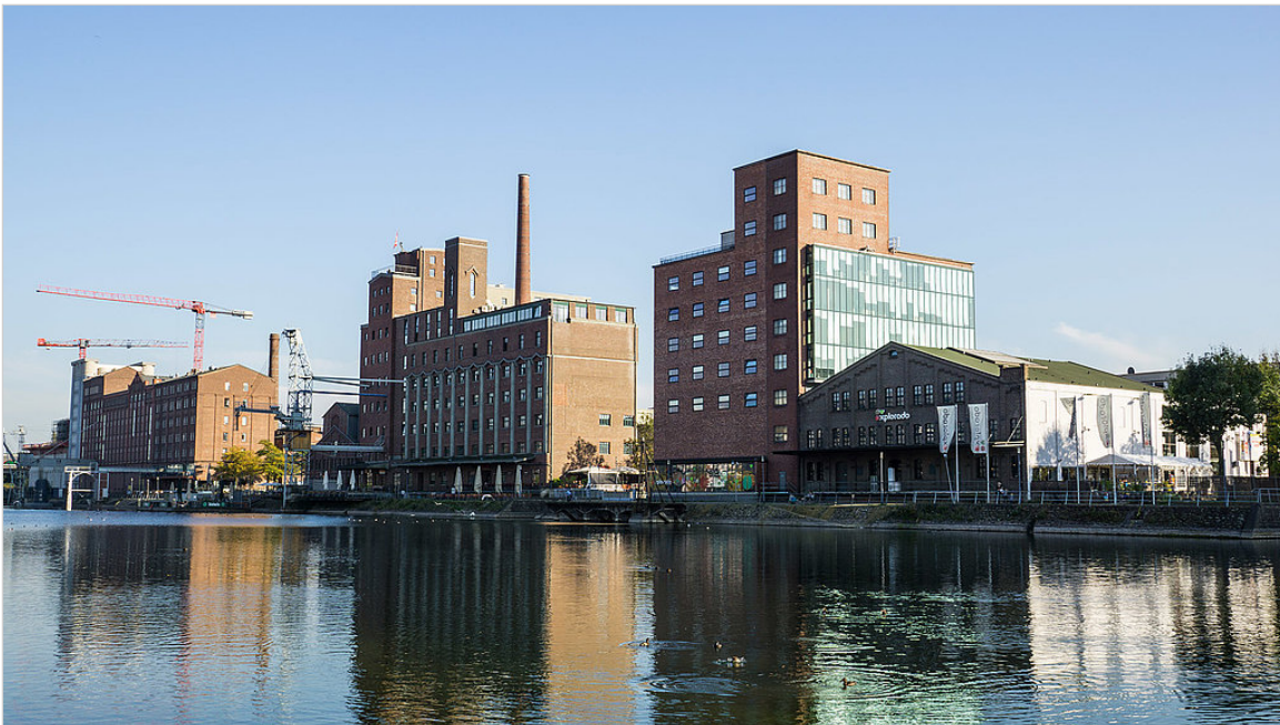
Der Duisburger Innenhafen, Sitz der startport GmbH.

Bis zum 31. Oktober können sich interessierte Gründer unter folgendem Link für das neue Jahr bewerben: www.startport.net/bewerben