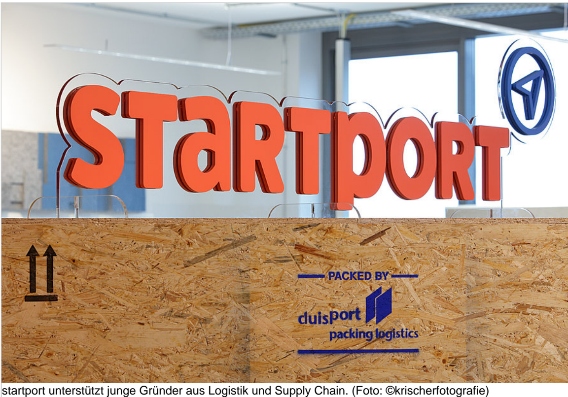
startport unterstützt junge Gründer aus Logistik und Supply Chain.

Initiativkreis Ruhr GmbH Alfred Herrhausen-Haus Brunnenstraße 8 45128 Essen