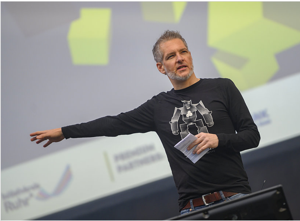
Eröffnung des RuhrSummit 2019